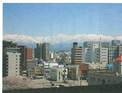
懇親会の窓には、年間数日あるかどうかという立山連峰の眺め。手前には桜が満開を迎えていました。