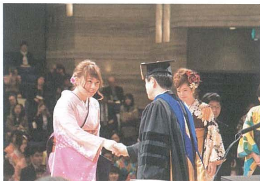
2015年度 卒業証書・学位記授与式 (2016年3月15日) 於：金沢市文化ホール

現在、北陸3県外からも真面目に学ぶ学生に本学を選んでもらえるようにと思っておりますが、「教育寮の建設」もできず、財政的に非常に厳しい状況です。上記改革により、より多くの入学希望者を集めたいと思っておりますので、良い学生のご紹介や財政的支援によって、同窓生の皆様のさらなるお助けを是非ともよろしくお願い致します。