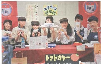
スイーツ研究所の学生と一緒に 右端

先日、第30回管理栄養士国家試験の発表がありました。今回は例年に比して合格率は低く、2年制栄養士課程卒業生の平均合格率は9.6%でしたが、本学の卒業生は13.3%と北陸地区の2年制養成校の中では最も高い合格率をあげ、第20回からの累積合格者数もトップとなっております。今後も卒業生の方々がこれに続くことができるようリカレント教育としての「管理栄養士国家試験受験準備対策講座」もこれまで通り力を入れたいと考えています。