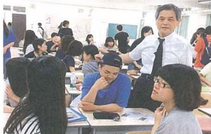
授業後学生の質問を受けている 右上

昨今、子どもをとりまく環境が激変しており、それに応じた保育者の対応が求められ、保育の領域が拡大しています。本学はこうした状況に取り組める質の高い保育者を養成すべく、より実践的な科目配置を行います。具体的な一例として、入学当初の一年次前期に履修する「地域社会と子ども」において保育所・幼稚園・小学校の実践現場を参観し、後のディス