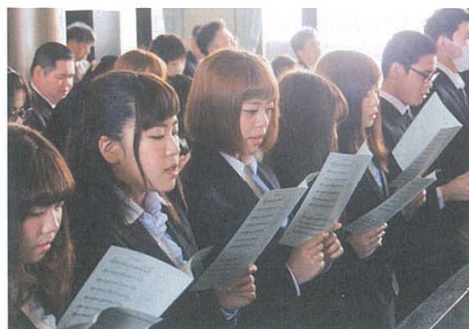
2016年度 入学式 (2016年4月2日) 於：番匠鐵雄記念礼拝堂