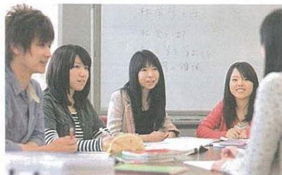
学生と一緒に 中央

社会学科ではキャリア教育に力を入れています。今年度から導入している新カリキュラムでは、1年次から3年次までキャリア科目を必修としました。その中で実施しているのが、本学科独自のプログラムMIP（Mission Innovation Project）です。これまで1年生を対象としたMIP1を実施してきましたが、2年生を対象としたMIP2と3年生を対象としたMIP3を加えバージョンアップしました。地元企業の課題に取り組むことで4年間の大学生活で何を学べばよいのかを認識し、やる気のスイッチを入れるMIP1、グローバル企業の複雑な課題に取り組むことでグローバルな視点を養うMIP2、そしてインターンシップなどの形で現場を経験するMIP3と一貫したコンセプトで社会に求められる人材を育成していきます。