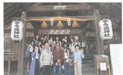
フィールドワークで学生と記念写真前列 右端

2016年3月の卒業生の就職率は、97.3%でした。一般企業や金融機関の事務職や、医療事務、旅行会社やホテルなどのサービス職、化粧品や自動車などの販売職など多彩です。就職支援として、アドバイザー・就職担当教員・学生支援課が連携し、学生一人ひとりの適性に合った進路指導をしています。