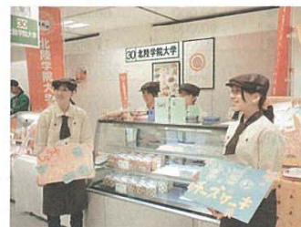
手作りのボードでPR

昨年に続き、今年も「大学は美味しい!! フェア（小学館主催）」に本学スイーツ研究所が参加しました。「やさしい“甘さ”」をテーマに、県産素材にこだわり開発したスイーツを高島屋新宿店で発表・販売。全国34大学の自信作が集まる中、高い注目を集めました。