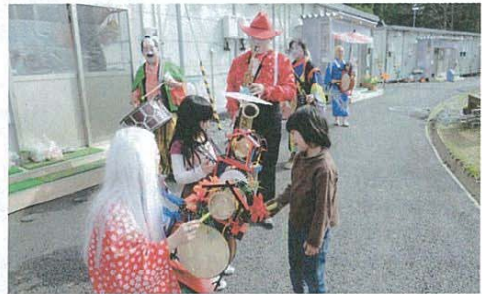
4月29日 南三陸歌津字葦の浜 仮設住宅前をチンドン隊が練り歩く。