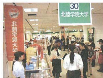
説明にも力が入ります