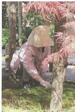
庭仕事。共に、心を込めて。

おこがましいですが、ぶどうの木が女将。それに下がる房がそれぞれの係で、来年も実がなるよう一日一日を大切に過ごすよう励みます。