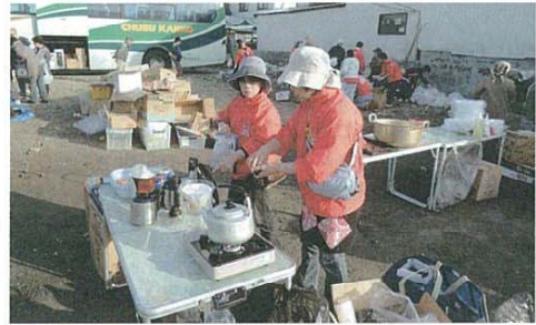
4月29日 石巻渡波地区 コーヒーコーナー準備中。